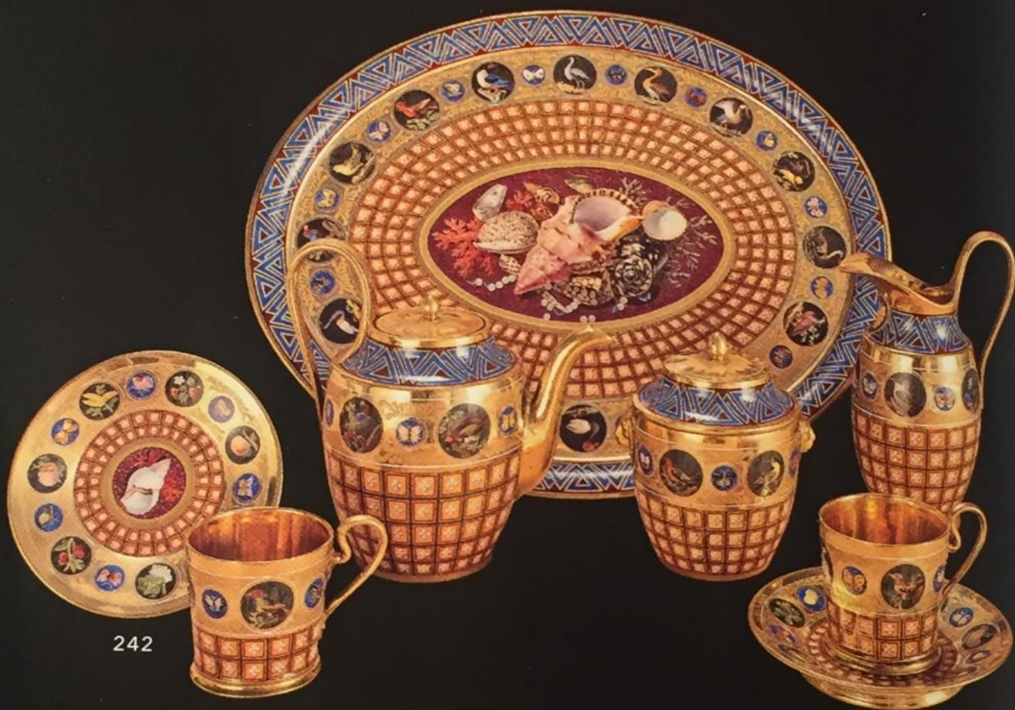
III. 2 Manufacture de Sèvres, 1812, Service à thé imitation de mosaïques, offert à la comtesse de Montesquiou pour les étrennes de 1813 Cooper Hewit museum