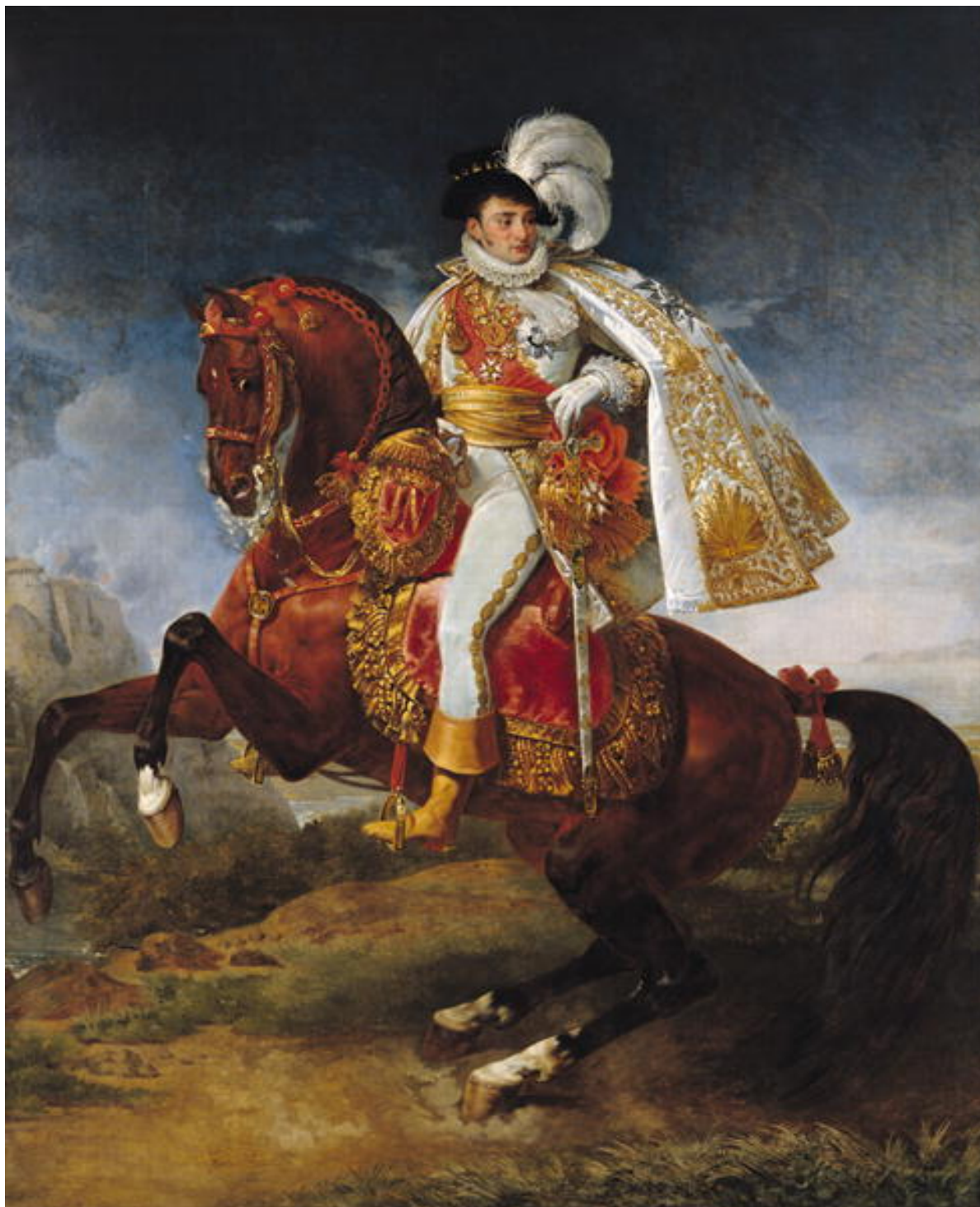
Portrait équestre du roi Jérôme Bonaparte, roi de Westphalie, par Antoine-Jean GROS (1771-1835)