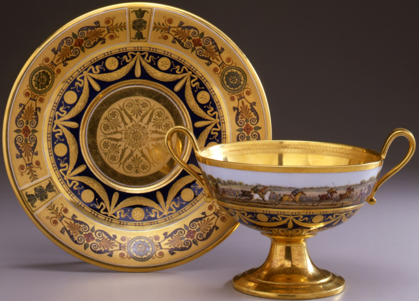
III. 3 Manufacture de Sèvres, coupe « à bouillon hémisphérique » décorée d'une course hippique aux Champs de Mars offerte en présent du Nouvel An 1812 à la comtesse de Montalivet, dame d'honneur de l'impératrice Marie-Louise, 1811. Musée Napoléon Ier, château de Fontainebleau.